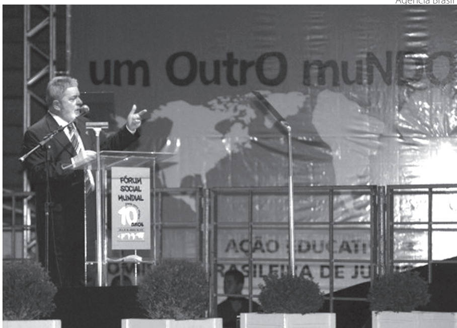
Presidente Lula prestigia o Fórum Social no sul do país