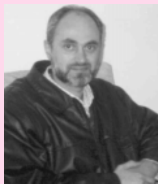
Sheikh Jihad Hassan Hammadeh

Embora um dos princípios do islamismo, religião predominante entre os árabes, seja a busca pela paz, o conflito entre Israel e palestinos está muito longe de um fim. A afirmação é do Sheikh Jihad Hammadeh.