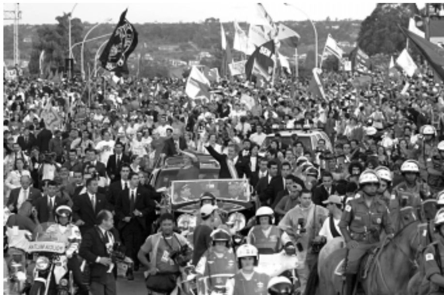
Presidente Lula e Sr a Marisa desfilam de carro aberto pela Esplanada

Com muita esperança e sem medo algum, brasileiros e brasileiras tomaram a Esplanada dos Ministérios para ver Lula assumir a Presidência. Representando nossa categoria, o SINPRO-ABC participou deste importante e inesquecível momento da história do país